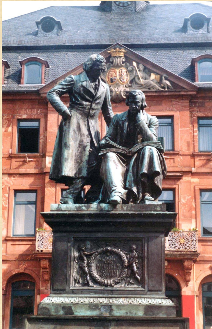
Brüder Grimm Denkmal in Hanau

Die Brüder Grimm sind weltbekannt ( world famous ) für ihre Sammlung von Märchen.